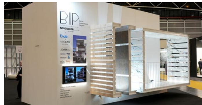
Fabricante de módulos de Construcción Industrializada