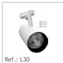
Ref.: L30 FOCO LED Superficie 30W