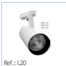
Ref.: L20 FOCO LED Superficie 20W