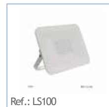
Ref.: LS100 FOCO LED Proyector 100W