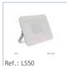
Ref.: LS50 FOCO LED Proyector 50W