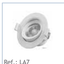
Ref.: LA7 LED ARO DICROICO 7W