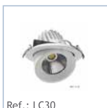
Ref.: LC30 LED EMPOTRAR CIRCULAR 30W