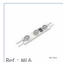
Ref.: ML6 MODULO LED PARA RETROILUMINADOS 6W