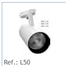
Ref.: L50 FOCO LED Superficie 50W