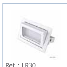
Ref.: LR30 LED EMPOTRAR RECTANGULAR 30W