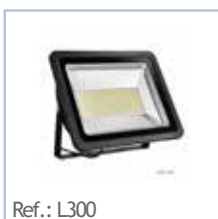
Ref.: L300 FOCO LED Proyector 300W